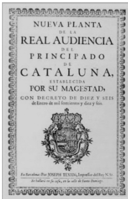
▶ Portada del decret de Nova Planta.

Per recaptar impostos el rei va crear la figura de l'intendent, responsable de recaptar i cedir només els diners que cregués necessaris per mantenir les estructures del principat. Aquest va aplicar un impost directe de càstig anomenat el reial cadastre.