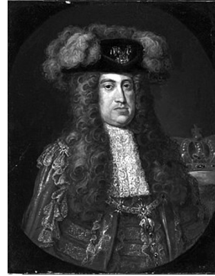
▶ Carles VI emperador del Sacre Imperi Romà-Germànic, Jan Kupecký. Museu Nacional de Varsòvia

L'any 1711 es produeix la mort de Josep I d'Ausburg, emperador de l'imperi austro-hongarès i germà de l'arxiduc Carles. Aquest és nomenat successor del seu germà com a nou emperador de l'Imperi, amb què l'equilibri de forces entre les potències europees donava un gir de 180°. La possible unió del que més endavant havia de ser Espanya amb Àustria en la persona de l'arxiduc podia ser més perillosa per a la Gran Bretanya i Holanda que la unió d'Espanya amb França, ja que suposava la reaparició del bloc hispà-germànic que tan poderós havia estat en els temps de l'emperador Carles V. La resta d'estats europeus, i sobre tot Anglaterra, acceleraren les negociacions de cara a una possible pau el més aviat possible i començaren a veure els avantatges de reconèixer a Felip V com a rei d'Espanya. Anglaterra es comprometia a reconèixer a Felip V a canvi de conservar Gibraltar i Menorca i d'obtenir avantatges comercials a Hispanoamèrica. Les converses formals s'obriren a Utrecht durant el mes de gener de 1712, sense que Espanya hi fos convidada en aquells moments. L'arxiduc Carles va ser escollit emperador del Sacre Imperi Romà Germànic, amb el títol de Carles VI, durant el mes de setembre de 1711 i fou coronat a Frankfurt. En conseqüència es veié obligat a abandonar Espanya, on va deixar com a regent a la seva esposa Isabel Cristina de Brunswick.