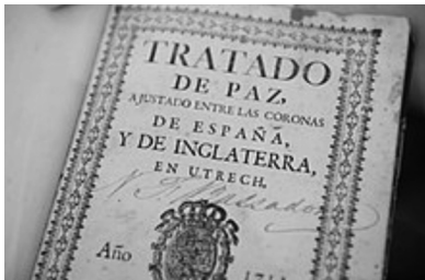
▶ Portada del Tractat de Pau d'Utrecht signat entre Espanya i Anglaterra.

El 10 juliol es signava el segon Tractat d'Utrecht entre Anglaterra i Espanya, amb què Menorca i Gibraltar passaven a la Corona britànica.