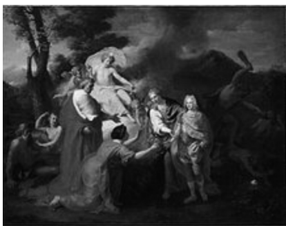
▼ Allegoria del reconeixement del Duc d'Anjou com a rei d'Espanya, per Henri Antoine de Favanne (1704)

Carles II, sota la pressió d'Harcourt, va acceptar que l'opció francesa era la millor per garantir la integritat de la monarquia catòlica i l'imperi hispà. El rei va testar el 2 d'octubre de 1700, un mes abans de morir a favor de Felipe d'Anjou, fill segon del delfí de França i nét del rei Lluís XIV, al qual va nomenar successor de tots els seus regnes i dominis, sense excepció, amb que s'invalidaven els dos tractats de partició.