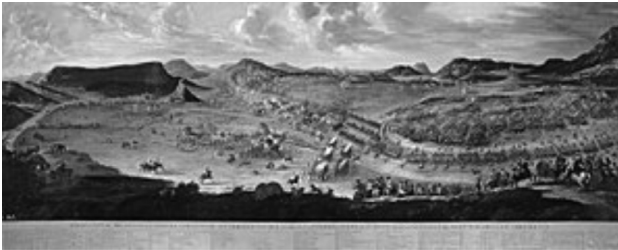
▼ Batalla d'Almansa (1707). Oli de Buonaventura Ligli i Filippo Pallotta (topògraf), 1709. Museu del Prado

L'ofensiva borbònica contra el sud valencià s'inicià el 1706 amb la recuperació de la regió murciana i alacantina. El 25 d'abril de 1707 tingué lloc la batalla d'Almansa amb que les tropes borbòniques recuperaven el Regne de València. Aquell mateix any també recuperaren Saragossa, Lleida i l'any següent Tortosa. La "Nova Planta" Borbònica s'establia als Regnes de València i d'Aragó.