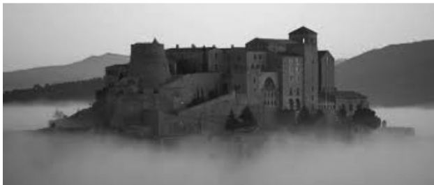
El Castell de Cardona, darrer reducte de la resistència austriacista a Catalunya. Patrimoni Cultural. Generalitat de Catalunya