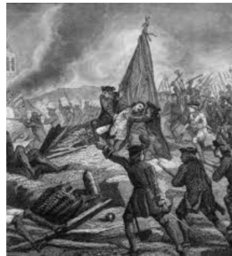
▶ La caiguda de Barcelona 11 de setembre de 1714. Publicat a Historia Nacional Geographic

Només quedaven com a reductes austriacistes Barcelona, el castell de Cardona i l'illa de Mallorca. Durant l'any 1714 les tropes borbòniques van posar setge a la ciutat de Barcelona amb un exèrcit de 40.000 homes i 140 canons durant dos mesos. Barcelona va resistir gràcies al coratge del Conseller en Cap, Rafael de Casanova, i el general Antoni Villarroel. L'11 de setembre de 1714 el mariscal Berwick ordenà l'atac. Els tres comuns (braç militar, Diputació del General i Consell de Cent) van publicar un ban cridant a la població de Barcelona a vessar la seva sang i la seva vida pel rei, pel seu honor i per la pàtria. La defensa dels catalans fou obstinada i ferotge. En la lluita van caure greument ferits Rafael de Casanova i el general Villarroel. El 12 de setembre se signà la capitulació de Barcelona i el 13 les tropes borbòniques ocuparen la ciutat. El Castell de Cardona es va rendir el 18 de setembre de 1714. Mallorca va caure el 2 de juliol de 1715. S'acabava la vigència de la Corona d'Aragó, i del Principat de Catalunya com a territori amb uns furs, unes institucions, una llengua i una cultura pròpies i s'integrava a Espanya.